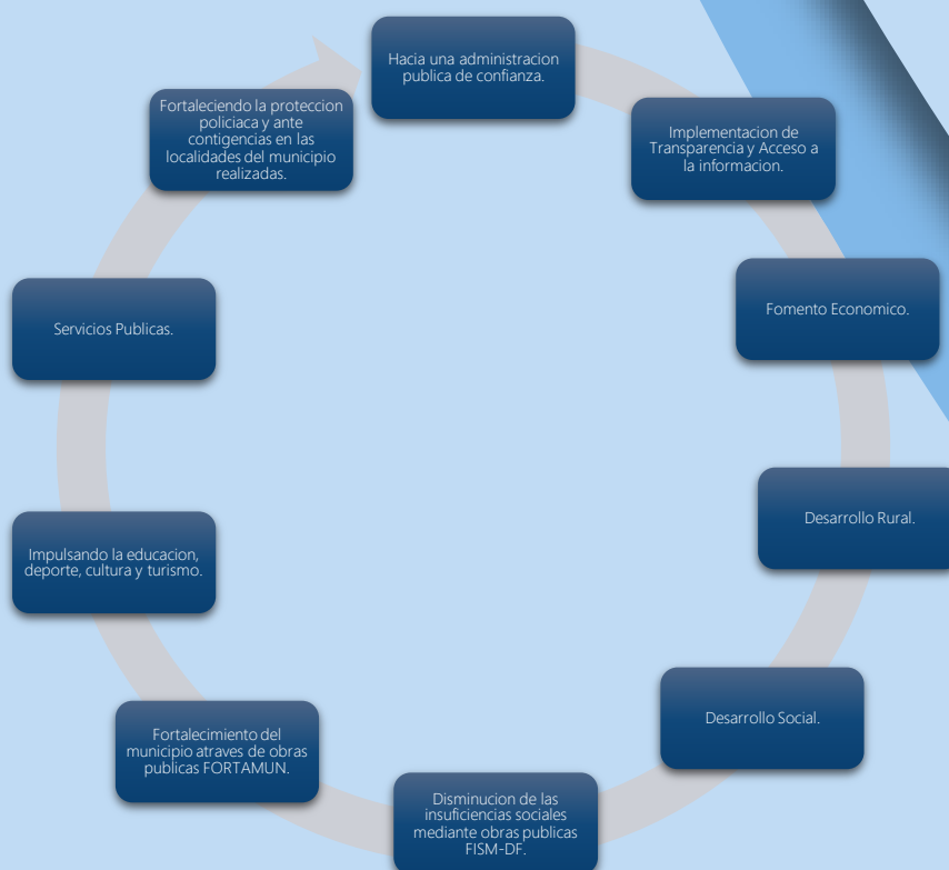
Tabla 1. Programas Presupuestarios 2022.

El monitoreo y seguimiento se llevará a cabo de forma trimestral, midiendo su avance y observando que la asignación de recursos guarde relación con los objetivos, metas y prioridades contenidos en el Plan Municipal de Desarrollo 2021-2024, utilizando la Metodología del Marco lógico. Son 10 los Programas Presupuestarios del ejercicio fiscal 2022, los cuales son: